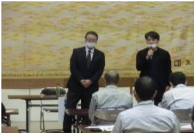
(地域おこし協力隊員紹介)