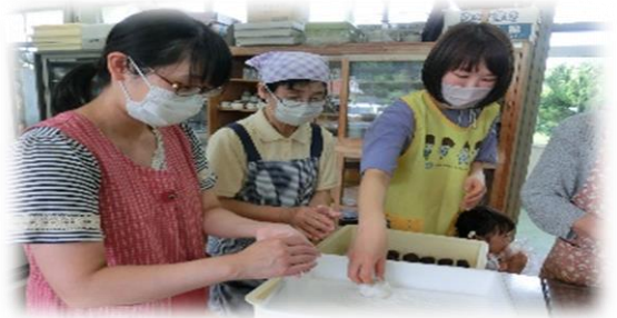
初めての貴重な体験です