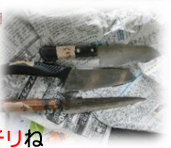
料理も、バッチリね