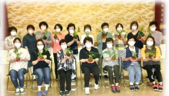
今年の夏は風鈴の音色で快適に 過ごせそうです