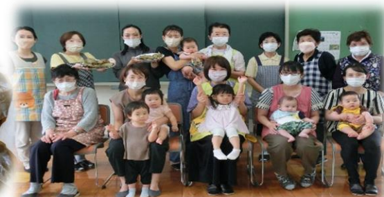
家でも作ってみたいと思います