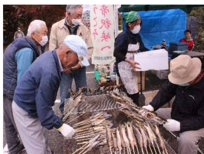
アユ・アマゴの塩焼き