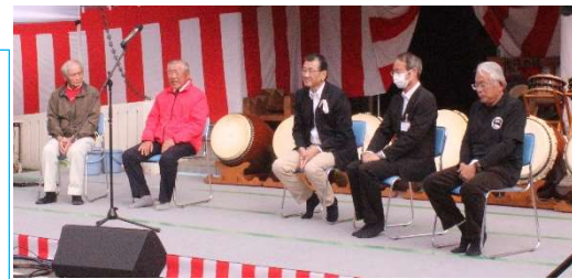
実行委員長と来賓の皆さん

前日、早朝から準備作業、そして当日は売店の開店準備と販売、そしてまつり終了後の後片付けと多くの皆様の協力をいただき大変ありがとうございました。