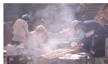
煙の中、やきとり焼いています