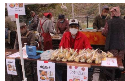
から揚げと野菜天ぷら