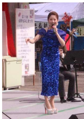
香取優希 演歌メロディ