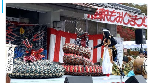
比婆荒神神楽子ども神楽 おろち退治