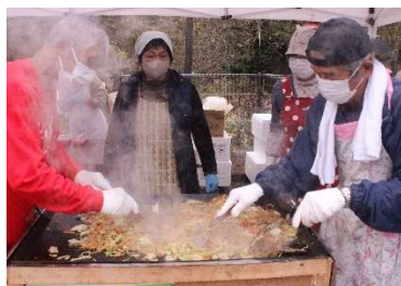
焼きそば 定番です