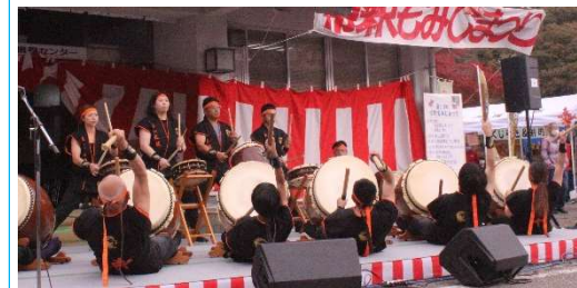
永江太鼓保存会の迫力ある演奏