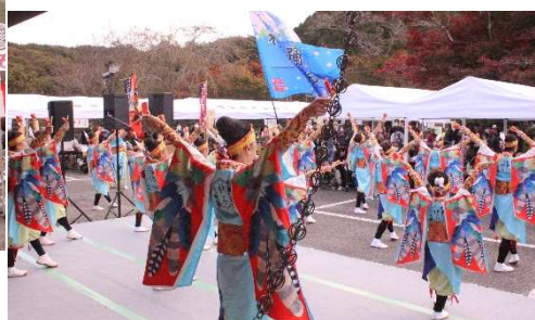
神石踊娘隊きらきら星の元気な踊り