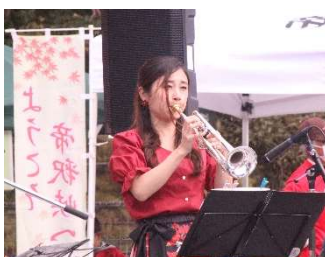
AKT36 トランペット演奏