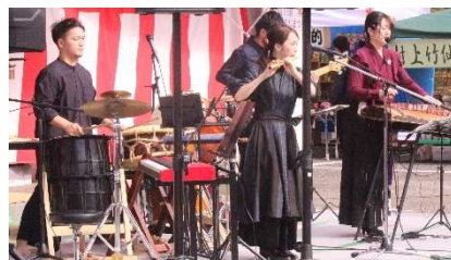
Sora 韓国箏と篠笛演奏