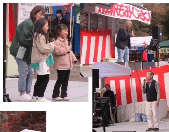
のど自慢の皆さんが自慢の歌を披露