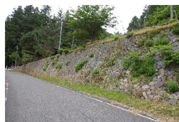
フェンスの取り付け