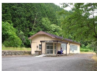
照明器具の取り付け