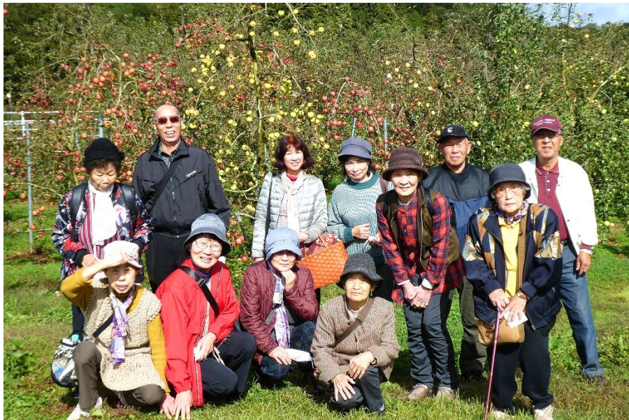
大阪リンゴ園にて記念撮影

私も参加させてもらい、総勢13名での参加となりました。天気はあいにくの曇り時々雨にて小雨が降ったり止んだりの繰り返しでしたが、高野町では雨に降られることなく平和に過ごせラッキーでした(*^*)当初はリンゴ狩りの予定でしたが、リンゴの品種が入れ替わりの時期で収穫後のものしかなくリンゴ狩りはできませんでした。アップルロードにある直売所巡り・車でドライブに予定を変更しましたが、それぞれの車の中はいい雰囲気を楽しんでいたそうです。この時期は他所からもリンゴを買い求める方が多く来られるので、直売所では売り切れになっている所もあり、私たちが何軒か回ってリンゴをGETすることができました🍏