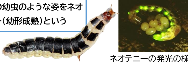
ネオテニーの発光の様子

飛ぶことのできないメスが発光するケースの方が多いです。飛べる雌雄は両方が発光しコミュニケーションをとります。