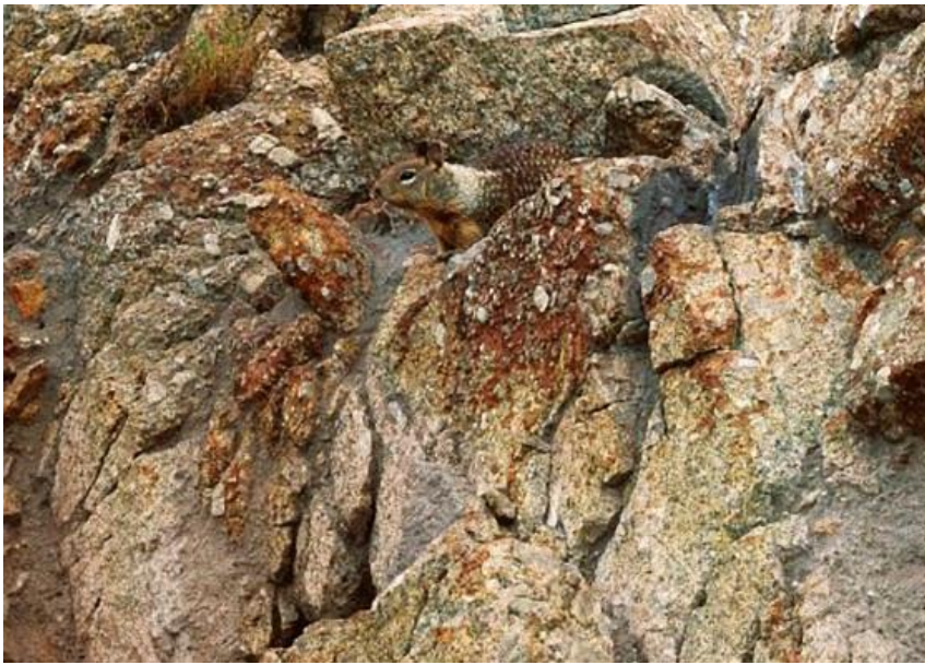
⑤ カリフォルニアジリス