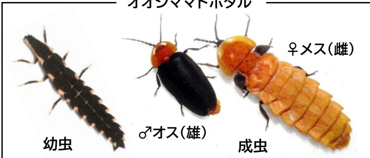
オオシママドボタル