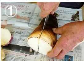
タケノコを縦に割ります

先月号で少しだけお伝えしたタケノコの皮を早く剥く方法をご紹介します。要領を得れば10秒くらいでできてしまうので、知らなかったという方がいらっしゃれば、是非やってみてください。