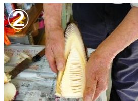
親指で下へ押さえて外皮をいっせいにむきます