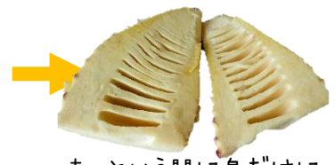
あっという間に身だけになります