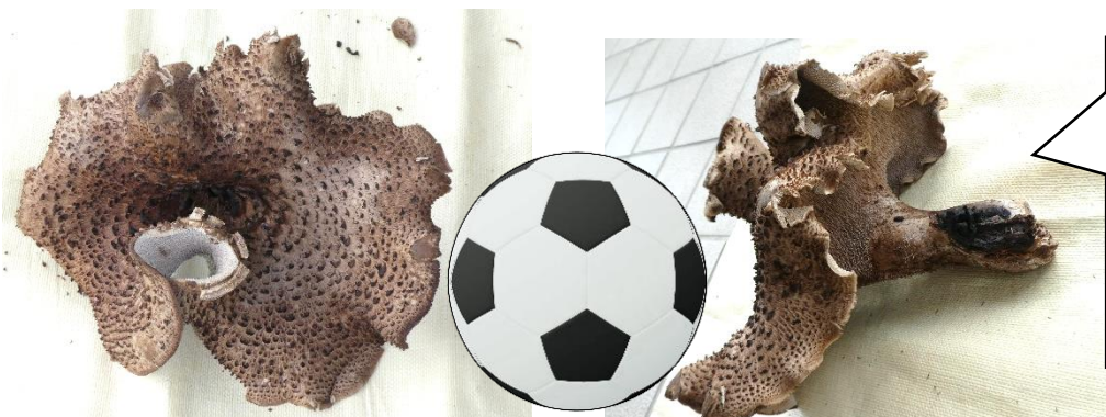
サッカーボールとの実寸比較サイズ

某OGさん おじさん が発見し、採って帰られた香茸です。 35×35cmはあろうかというサッカーボールより大きく、重量は2kgもあるビッグサイズの香茸でした!!!