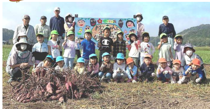
馬場地区の皆さんと高保育所の園児