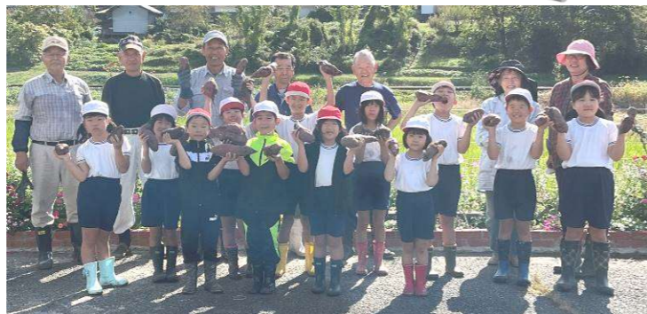
悠遊会の皆さんと高小学校1.2年生