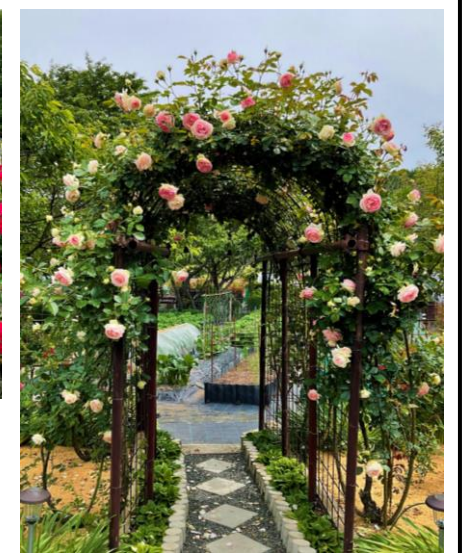
← 三上憲昭邸 ↓