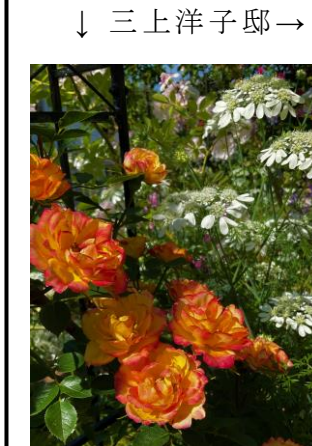
↓ 三上洋子邸 →