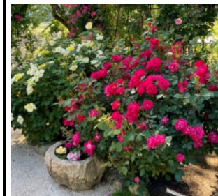
↑ 根尾邸 →