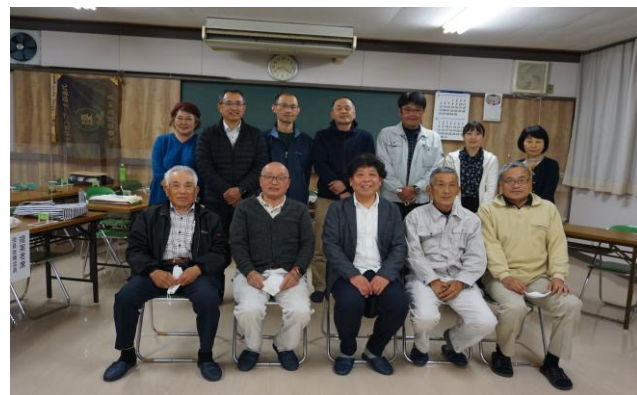
高自治振興区役員