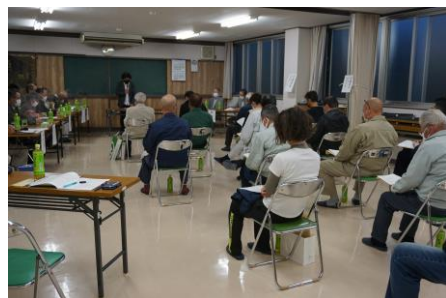
←会議の様子 (敬称略)