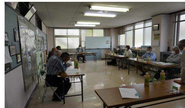
会議(理事会)の様子