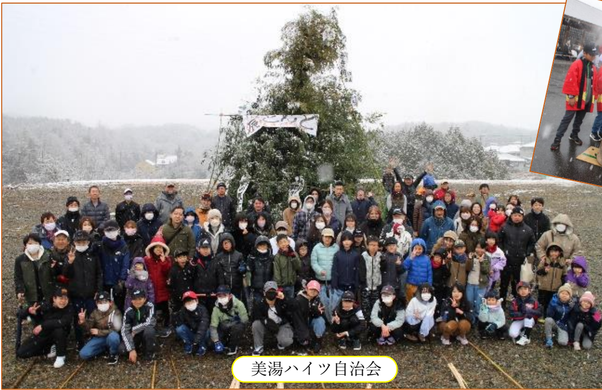
美湯ハイツ自治会