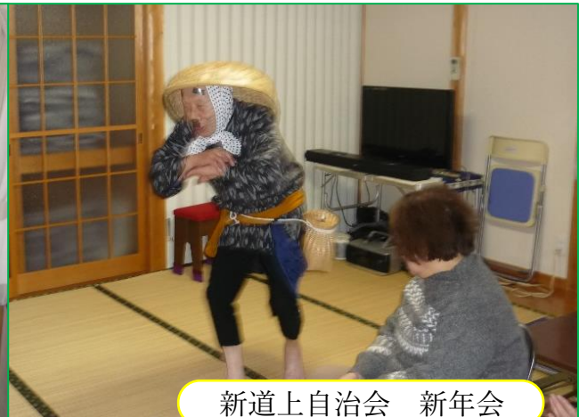
新道上自治会 新年会