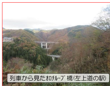
列車から見たオロチループ橋(左上道の駅)