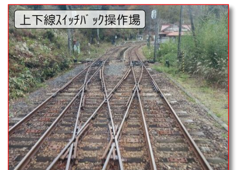
上下線スイッチバック操作場