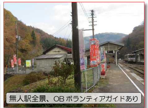
無人駅全景、OB ボランティアガイドあり