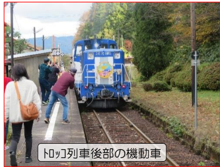
トロッコ列車後部の機動車