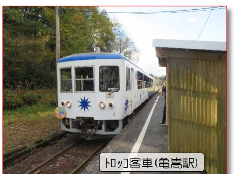
トロッコ客車(亀嵩駅)