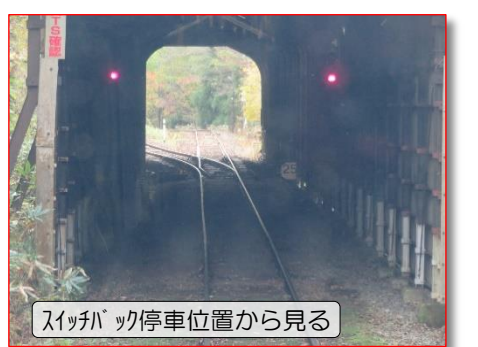
スイッチバック停車位置から見る