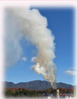
狼煙点火は 11時30分頃を予定