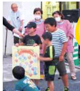
カレーライスとゼリーの おもてなしへお礼の メッセージを渡しました