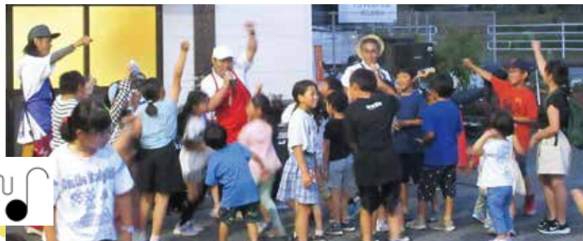
子どもたちが集まって大盛り上がり!!