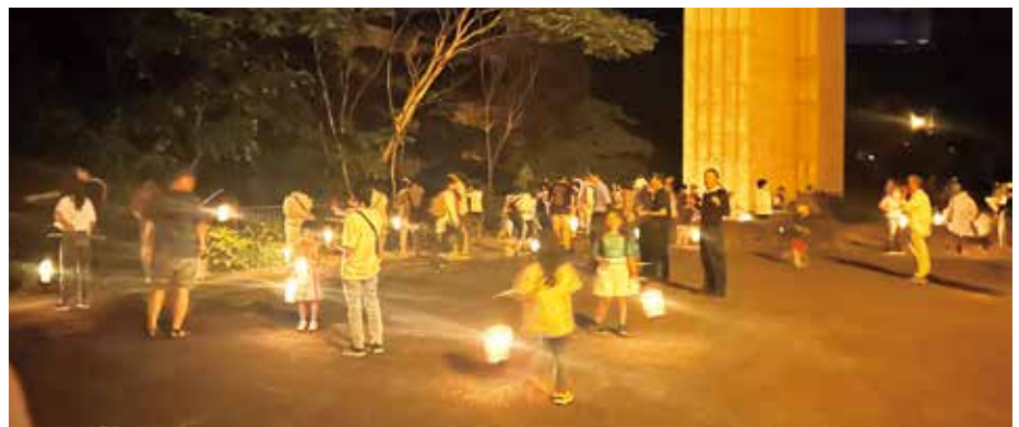
ホタルの観察場所 たくさんのホタルが飛んでいました!