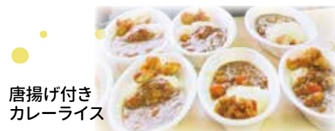
唐揚げ付き カレーライス