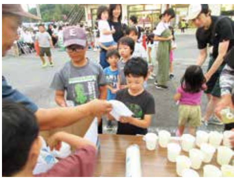
青年部さんがお菓子とジュースを子どもたちへプレゼント