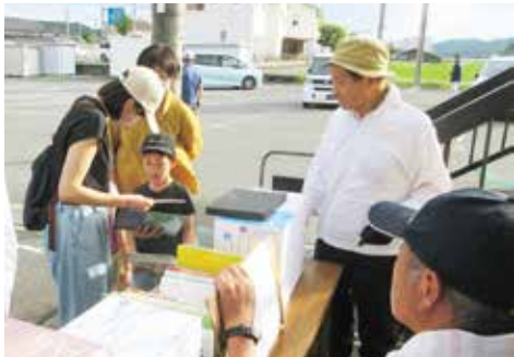
会場の一部では、みなさまから寄贈していただいた本の無料譲渡も行い、子どもたちに好きな絵本を持って帰ってもらいました