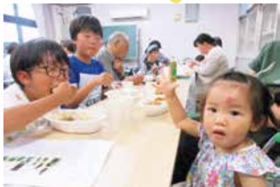
カレーライスとゼリーを 美味しくいただきました!