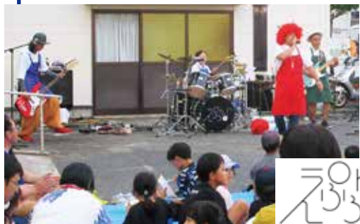
子ども向けバンド 『えぶろん♪』さんによるライブ