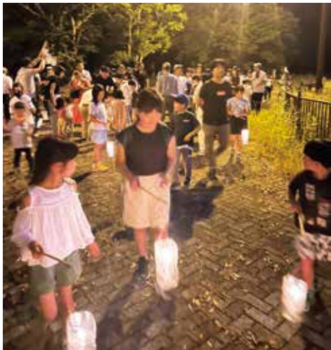
老人部さんの手作り提灯で観察場所へ