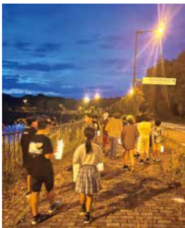
観察場所近くの駐車場から、 ほたる見れるかな〜?と わくわくしながら向かいました