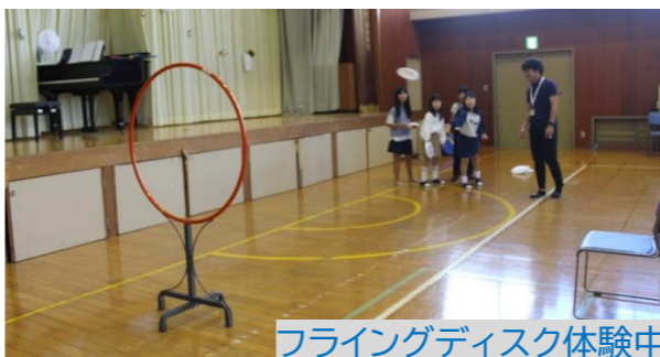
フライングディスク体験中