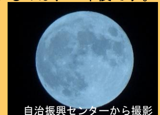
自治振興センターから撮影

9月29日(旧暦8月15日)の夜、満月の中秋の名月となりました。次に中秋の名月と満月が一致するのは、7年後です。