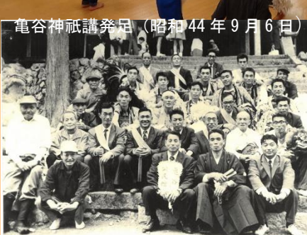
亀谷神祇講発足(昭和44年9月6日)