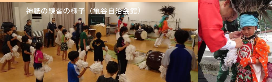
神祇の練習の様子(亀谷自治会館)