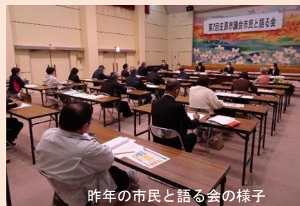
昨年の市民と語る会の様子