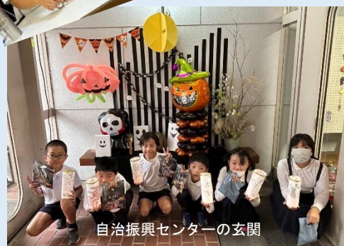
自治振興センターの玄関