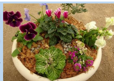
—昨年の寄せ植え教室（秋）の様子