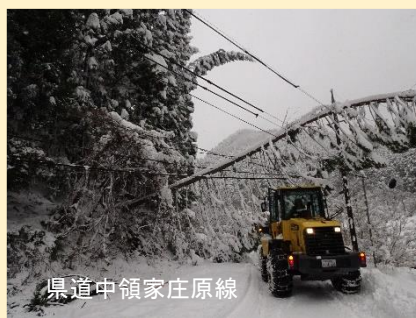
県道中領家庄原線