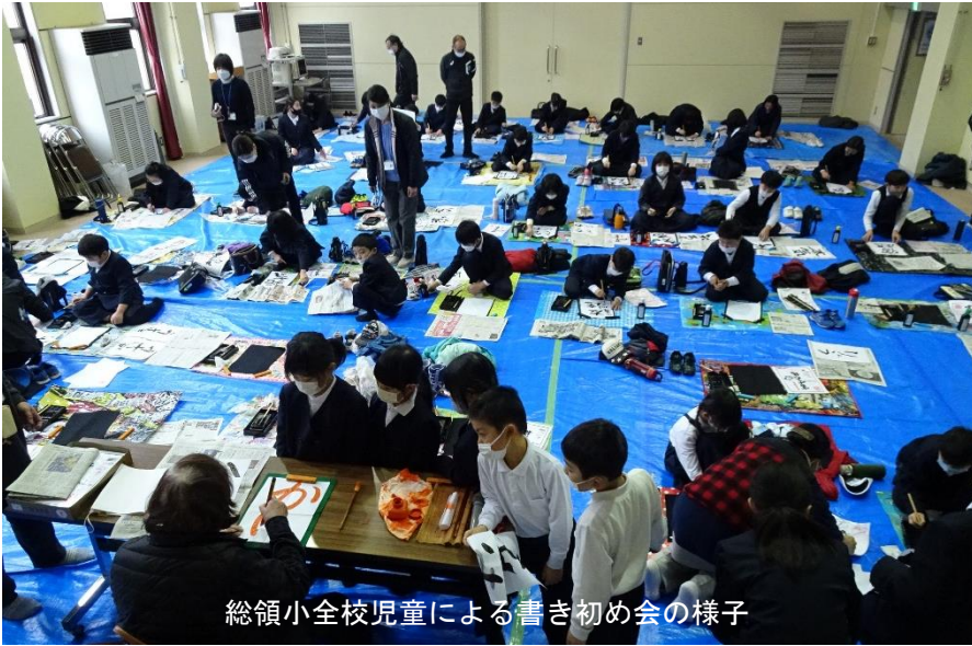
総領小全校児童による書き初め会の様子