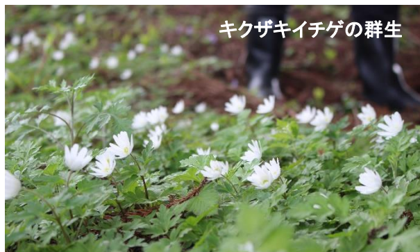
ククザキイチゲの群生

高野でククザキイチゲを、森脇でオキナグサを、吾妻山でオオタチツボスミレの群生やニヨイスミレ、ダイセンクスミレなどのスミレ類、エンレイソウ、フデリンドウ、ネコノメソウ、ショウジョウバカマなどの山野草を観察しました。