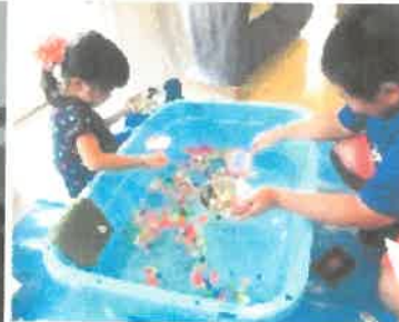
「夏休み映画上映会の縁日」