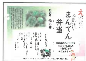
「配食サービス事業のお弁当と包み紙」