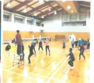
「ソフトバレーボール大会」