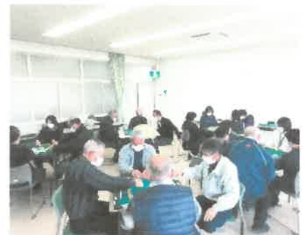
「健康マージャン講座」