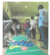
「地域で元気を育てる会」