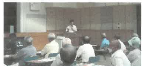
「鳥獣被害対策セミナー」