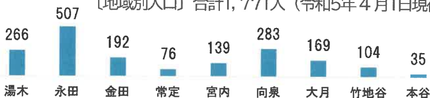
〔地域別人口〕 合計1,771人 (令和5年4月1日現在)