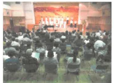
「あんだんて記念コンサート」