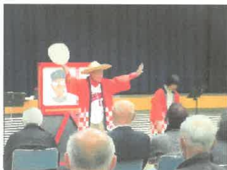
創年大学講座「カープ大型紙芝居」