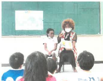
「ワールドブック交流会」