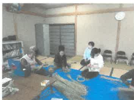
子育て応援プロジェクト「しめ縄飾り」