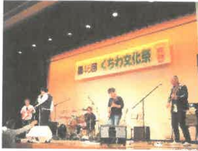
「口和ミュージックナイト」