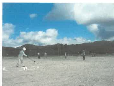
「老人グラウンドゴルフ大会」