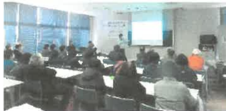
「お片付けセミナー」