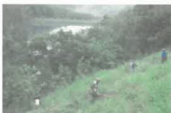
「青い池の環境整備」