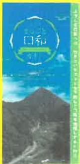
「口和まるごとガイド」