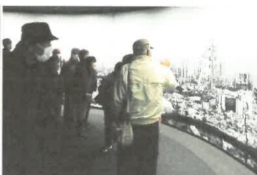
創年大学講座「社会見学」