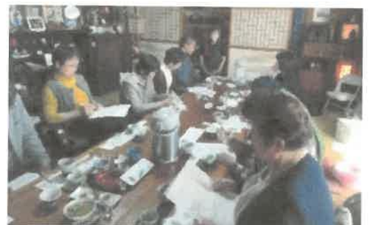
「レシピ開発視察研修」