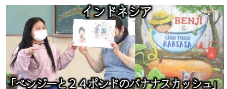
「ベンジーと24ポンドのパナナスカッシュ」

外国の物語を楽しんだ後は、質問コーナーや英会話体験、児童による絵本の朗読などで楽しく交流しました。（3/27）