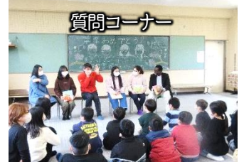
参加した児童も絵本を朗読し