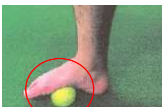
足の裏でボールを転がす