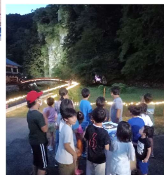
子ども達による点灯