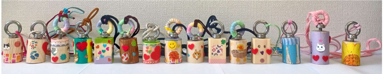
バードコールの作品