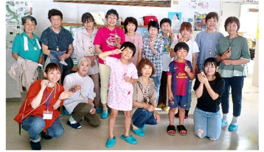
笑顔の参加者の皆さん