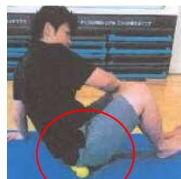
床に座って、おしりの部分をほぐす