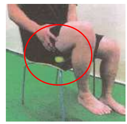
←椅子に座ってもできます