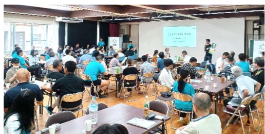
地元の魅力について意見交換

メニューは冷やしうどんとおにぎり・おかずで、「とても美味しかったよ」と評判がとてもよかったです！