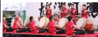
楽しいパフォーマンス