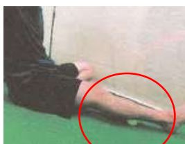
ふくらはぎ・ふとももをボールでほぐす