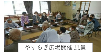
やすらぎ広場開催 風景