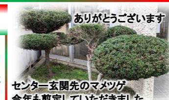
ありがとうございます センター玄関先のマメツゲ 今年も剪定していただきました

令和6年12月28日(土)から 令和7年1月5日(日)まで 本年も大変お世話になりました よいお年をお迎えください!