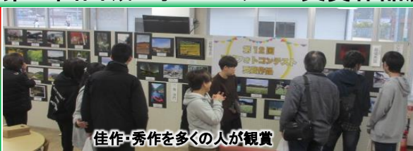
佳作・秀作を多くの人が観賞