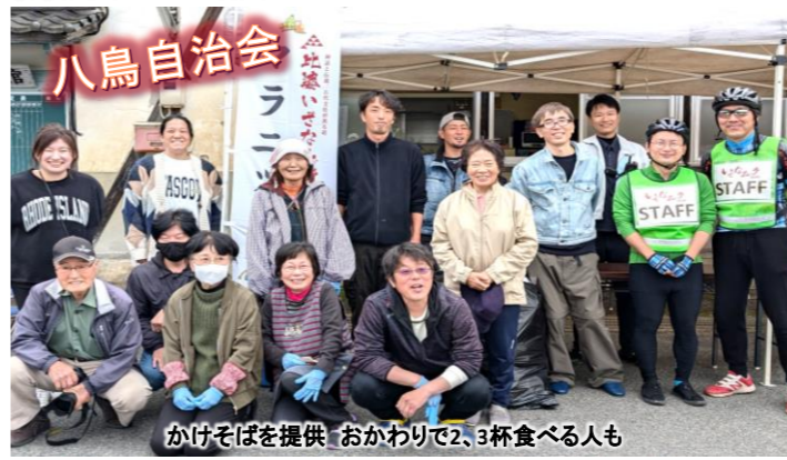
八鳥自治会 かけそばを提供 おかわりで2、3杯食べる人も

○夢公園前エイドステーション ・コーヒー(ホット)・リンゴアップルティー(ホット)・カステラ(大国堂)にリンゴのコンポートとリンゴゼリーを合わせたスイーツ・醤油アイス ○やませみ前エイドステーション ・そば・コーヒーゼリー