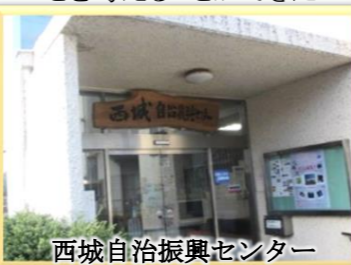
西城自治振興センター