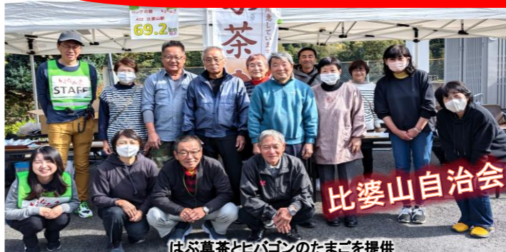
はぶ草茶とヒバゴンのたまごを提供

西城自治振興区は4か所のエイドステーションを開設し、ランナーに笑顔と美味しさを提供しました