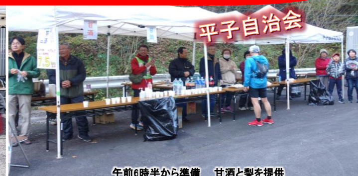
午前6時半から準備 甘酒と梨を提供