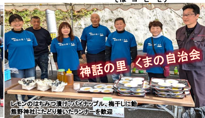
神話の里 くまの自治会 レモンのはちみつ漬け、パイナップル、梅干しに鮎熊野神社にたどり着いたランナーを歓迎

11月10日に沿線秘境駅を巡る! JR芸備線を応援と題してマラニック大会が行われました。比婆山駅は、ロングコース69.2km90名(内、落合駅~比婆山駅(ショートカット)まで芸備線乗車13名)・ショートコース15.6km180名(内、比婆山駅~備後西城駅(ショートカット)まで芸備線乗車47名)で唯一2コースのエイドステーション(休憩地点)となる為、比婆山駅周辺の方々を中心に住民13名のスタッフとエイド責任者2名で運営しました。