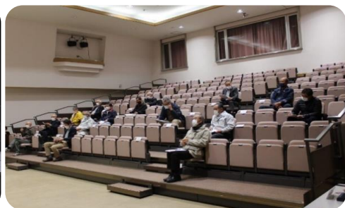
参加した西城地域の各自治会代表者

庄原市では、第二期長期総合計画にある人口減少を最重要課題に位置付けて、これまで地域産業や暮らしの安心安全、にぎわいと活力を中心に施策の推進をしてきました。