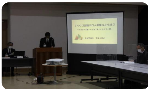
担当部局による資料の説明