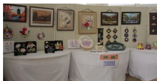
町内の方の手芸他作品