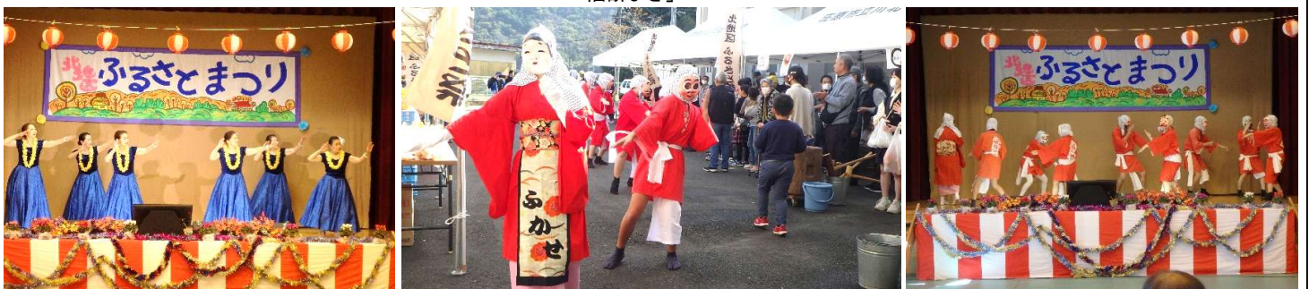
フラダンス「アロハローゼ庄原」