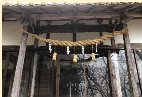
↑ 水越町 巖島神社