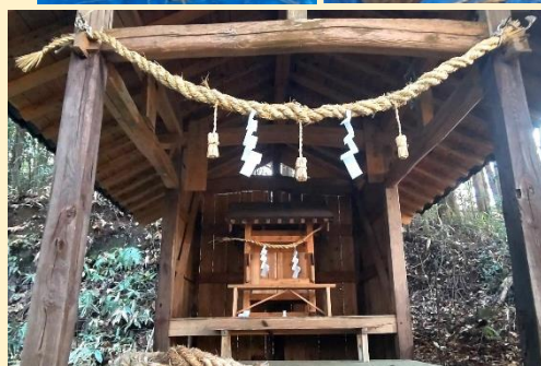
↑ 水越町 実盛神社

研究会の中では水越町の巖島神社、実盛神社、高茂町の高茂天満神社の氏子さんも参加され、大しめ縄を作成されました。今後は、大しめ縄づくりの技術力を高め、各自治会にある神社の大しめ縄を、地元住民の力で継承をしていけたらと願っております。