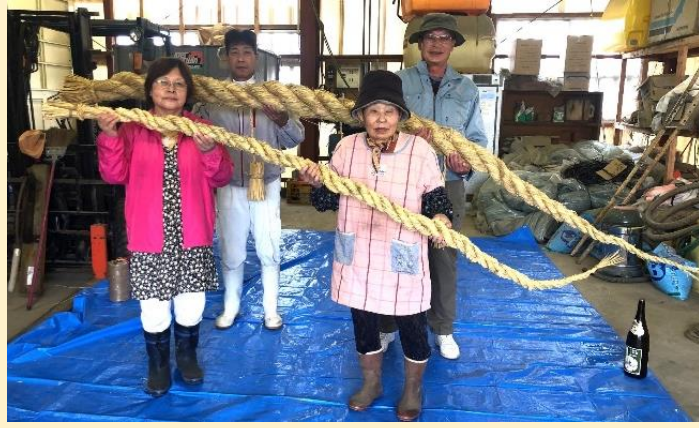
↑ 大しめ縄完成の様子 ↑