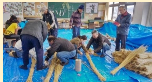
↑ ↓ 大しめ縄づくりの様子 ↓