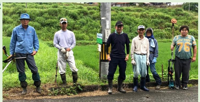
↑水越町 県道平和金田線チームのみなさんです