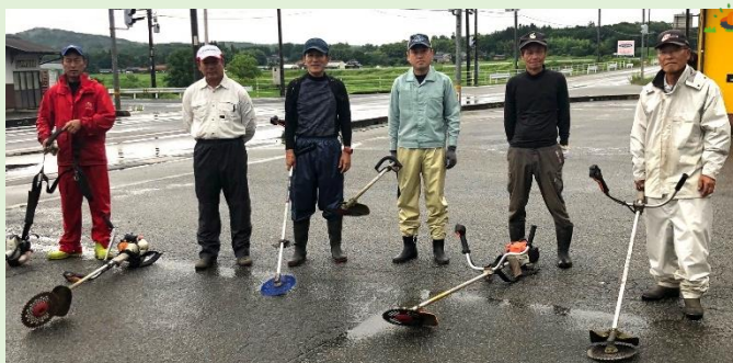
↑平和町 国道183号線チームのみなさんです