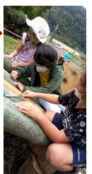
金ヤスリで削って