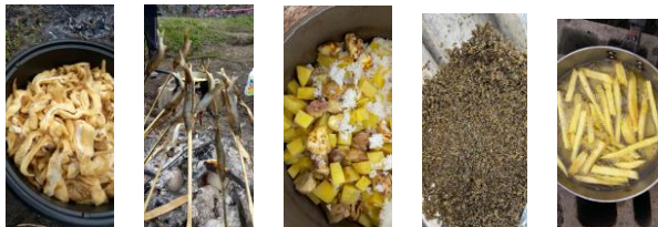
あかなほ煮しめ(さくらしめじ) あゆ焼き(西城川産) 栗ごはん(里山の夢新米) とんぶり(ほうき草の実) サツマイモの天ぷら