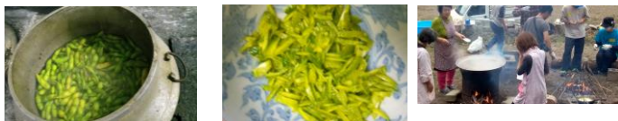
みんなで植えた大豆(枝豆に) ゆずの薬味 きのご汁も最高でした 地域の皆さん 珍しい食材提供ありがとうございました。