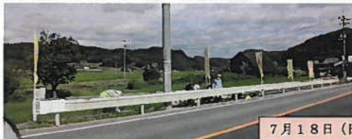
7月18日(日) 赤川自治会