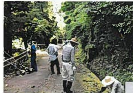
7月25日(日) 赤川・峰南自治会