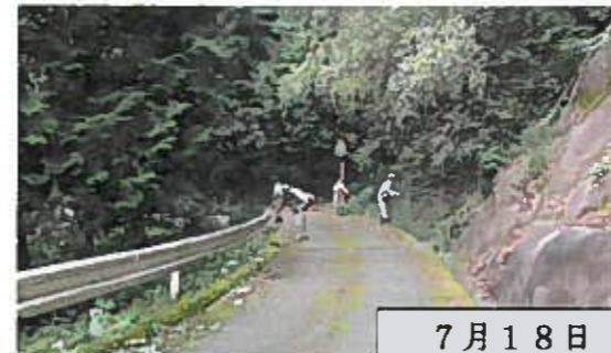
7月18日(日) 誠心自治会

延期となっていた青嶽山環境整備作業を順々に行っていました。 暑い中、本当にありがとうございました。