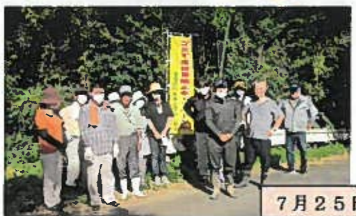
7月25日(日) 発展自治会