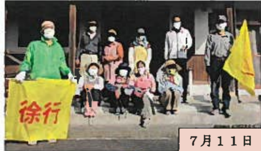
7月11日(日) 誠心自治会

不法投棄・ポイ捨て撲滅を目指して、全自治会が年間2回のパトロール・清掃活動を実施しています。同時に数本の幟を立てて通行人の意識を高め、活動を続けることによってポイ捨ての量が減少していくことを願っております。