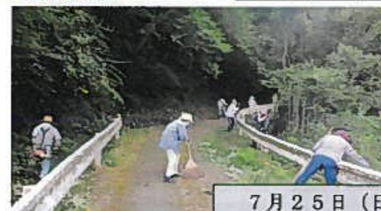
7月25日(日) 春田・津山自治会