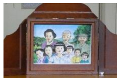
紙芝居は皆さんの子供の頃の時代背景で!