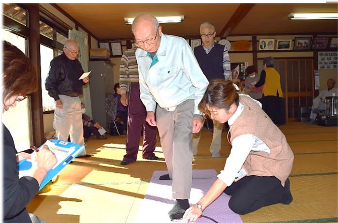
デイホーム北桜会