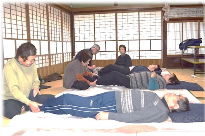
デイホームなごみ

各地区のデイホームでは、令和2年度会員の募集を行います。70歳以上のみなさん、一緒に介護予防と健康づくり、認知症予防など、自分の健康は自分で守るという意識を高めましょう!