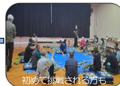
初めて挑戦される方も