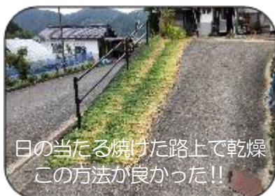
日の当たる焼けた路上で乾燥 この方法が良かった!!