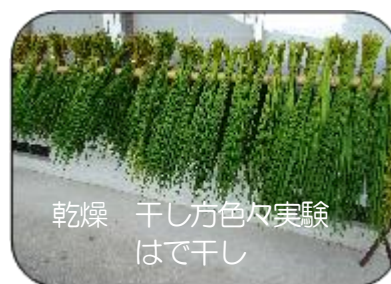
乾燥 干し方色々実験はで干し