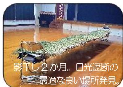
影干し2か月。日光遮断の最適な良い場所発見。