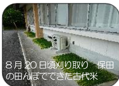
8月20日頃刈り取り 保田の田んぼでできた古代米