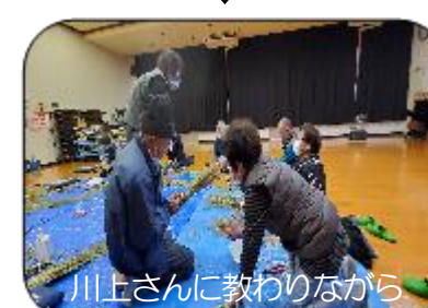
川上さんに教わりながら