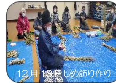
12月13日しめ飾り作り