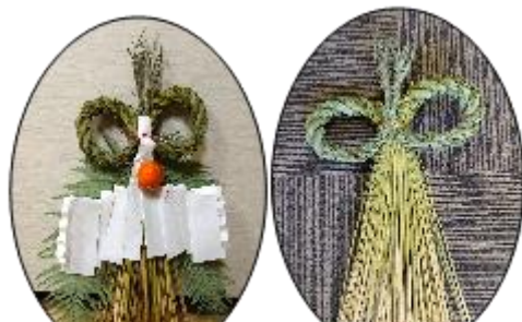
出来上がり 12月28日に飾ります (ウラジロは、28日にとりつけます)