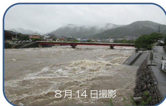
国道314号から見た田黒川