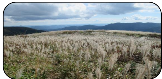
竜王山ススキの草原

これからは冬に向けて寒さが増してきますので暖かくしてカゼを引かないように注意してください。またインフルエンザの予防接種も始まっていますので希望される方は早めに接種しましょう。