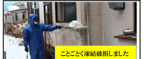
ことごとく凍結破損しました