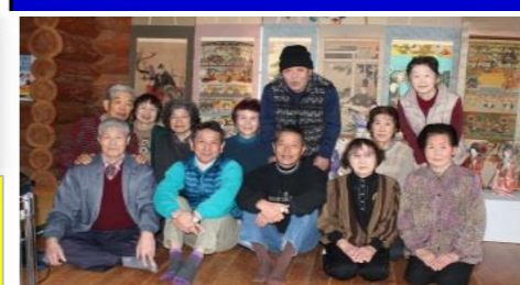
⑥ 八銚落合自治会「喜楽会」開催 3月9日