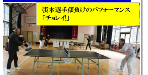
張本選手顔負けのパフォーマンス「チョレイ」