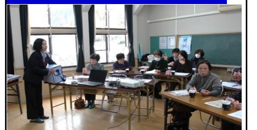
一般介護予防事業で、今回は腸の健康維持について学習しました