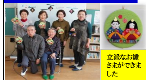
立派なお雛さまができました