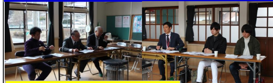
今年度の振り返り、次年度の取り組みについて協議しました