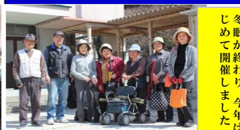
冬眠が終わり、今年はいよいよ開催しました