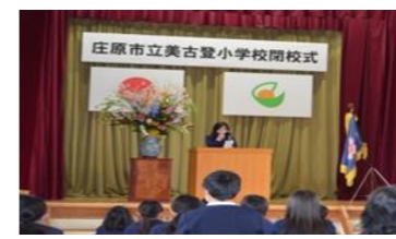
みんなの心は、美古登魂としてこれからも西城小で生きると信じています。(児童代表)