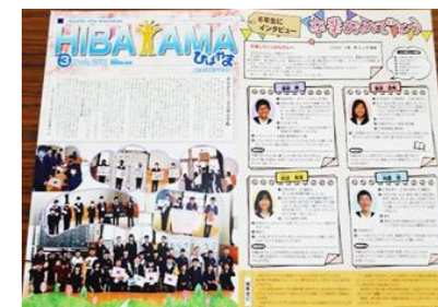
最後のPTA新聞「ひばやま」149号