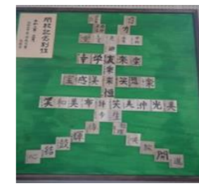
児童、先生方との合作「閉校記念制作」 一人一人が想いを込めて漢字一文字に表しました。