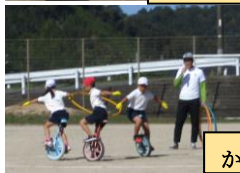
かがやく汗・技・チームワーク