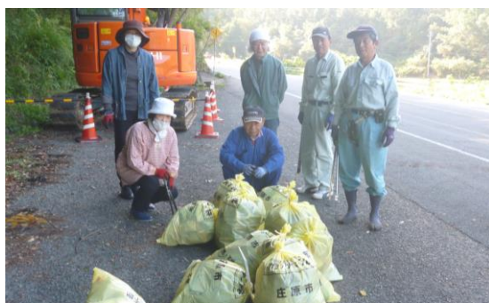
10月11日（日）峰南自治会

不法投棄・ポイ捨て撲滅を目指して、全自治会が年間2回のパトロール・清掃活動を実施しています。同時に数本の幟を立てて通行人の意識を高め、活動を続けることによってポイ捨ての量が減少していくことを願っております。