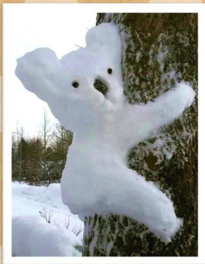
作品 No1 コアラ