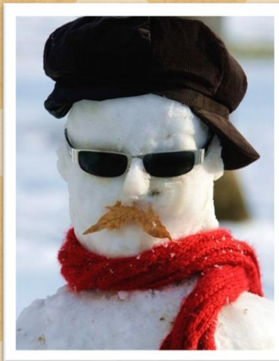
作品 No2 モダンなおじさん

毎年雪が降ると子どもたちと雪だるま作りをしています。今年は木についた雪や、雪ずりでできた塊からのインスピレーションで作ってみました。意外と上手にできたと思うのですが、いかがでしょう？ また雪が積もればトライしてみようと思いますが、もし皆さんが作った雪作品があれば教えてください！お披露目させてもらえると楽しいと思いますので、是非よろしくお願い致します。