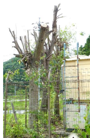
貯水槽横に植えられていた樫×3本 大きくなりすぎたので剪定しました