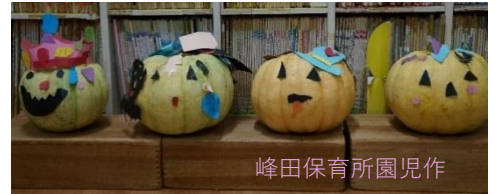
峰田保育所園児作