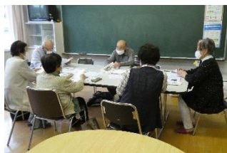
(本村郷土史くらぶ)

振興センターでの活動・センター使用は通常通りです。 ☆コロナで休校の時に良く遊びに来ていた子供たちはぱったり来なくなりましたが 各教室は再開して楽しそうです♪♪ 写真の教室以外にも、大正琴教室、銭バイククラブ パッチワーク教室、いけばな教室、茶道教室、健康麻雀クラブも！