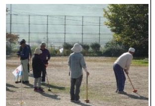
(グラウンドゴルフ)