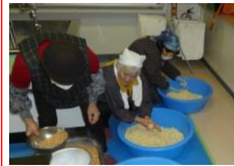
(糀と塩を混ぜています)