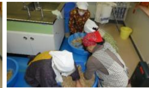
(糀と塩を混ぜた物にミンチ状の大豆を入れ、しっかり混ぜます)