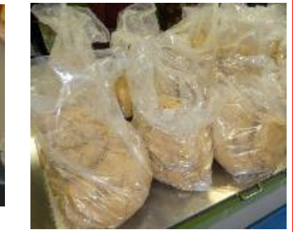
(混ぜた物を袋に入れました)