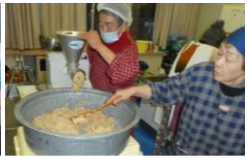
(煮上がった大豆を機械にかけミンチ状)