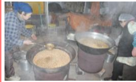
(大釜で大豆を煮ています)

今年も恒例の味噌作り(寒仕込み)を行いました。前々日から大豆を水につけ、前日に大豆を煮て、当日大豆を柔らかくなるまで、しっかり煮ました。煮あがった大豆を機械にかけミンチ状にして冷まし、糀と塩を混ぜたものと一緒にしてしっかり混ぜました。混ぜたものを丸めて袋に分け、各自持ち帰って容器に入れ寝かせます。