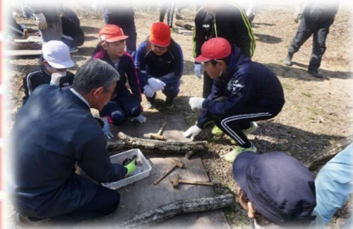
↑ 椎茸植菌の様子 ↑

最初の植菌作業では、児童と大人の見事な連携作業で、あっという間に種駒 1000 個を植え付けました。続いて、3～5年前頃に当時の児童が植菌し広場で管理し収穫期を迎えているホダ木から、椎茸の収穫作業を体験しました。