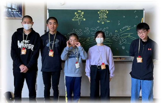
↑ 卒業生のみなさん