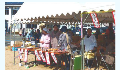
↑うどんバザーの様子

実行委員会直営でうどん等のバザーを計画しています。調理等のボランティアに、ぜひともご協力をお願いします。些少ではございますが、収益の中からいくらかの謝礼をさせていただきたいと思っています。協力いただける方は、10月18日(水)正午までに、振興センターにご連絡ください。