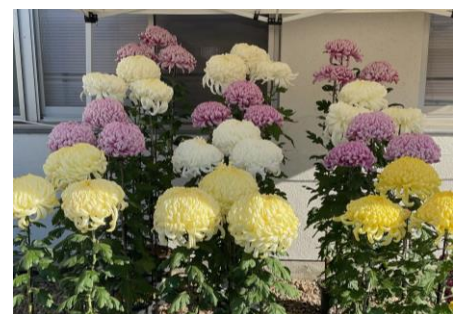
高菊友会 (11月10日撮影)