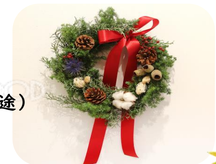
この様なリースを作ります