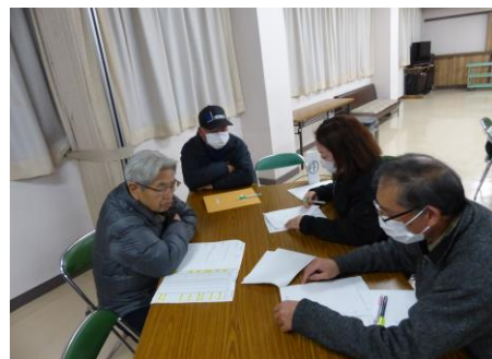
中川西・下川西地区