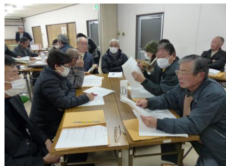
高取・上組・上川西地区