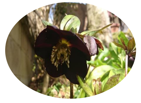
(寺川 三宅大さん宅 3月2日撮影)