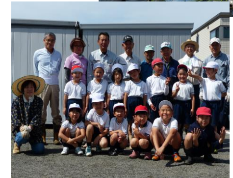
高保育所園児と馬場地区の“おじいちゃん”