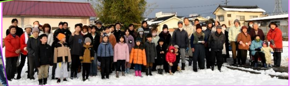
美湯ハイツ自治会