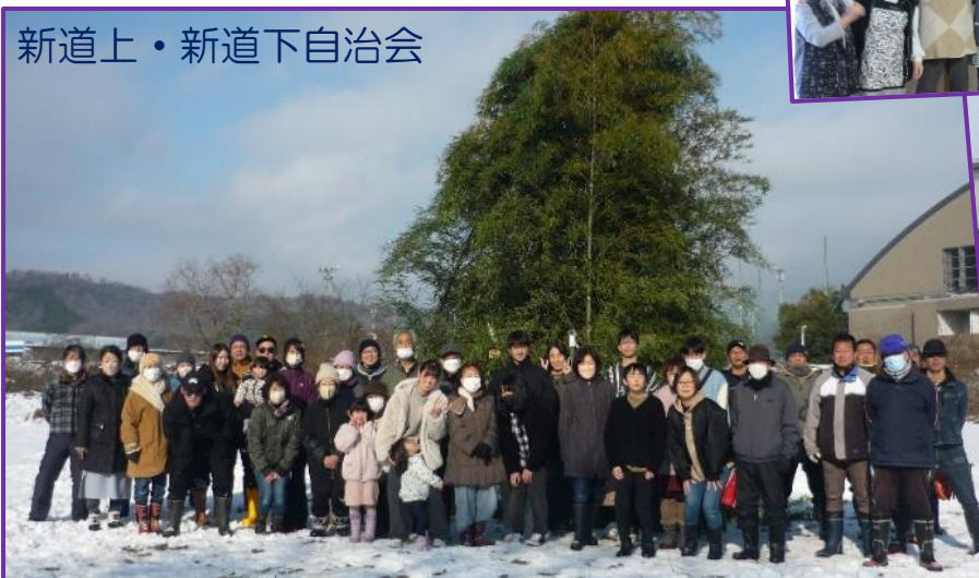
新道上・新道下自治会